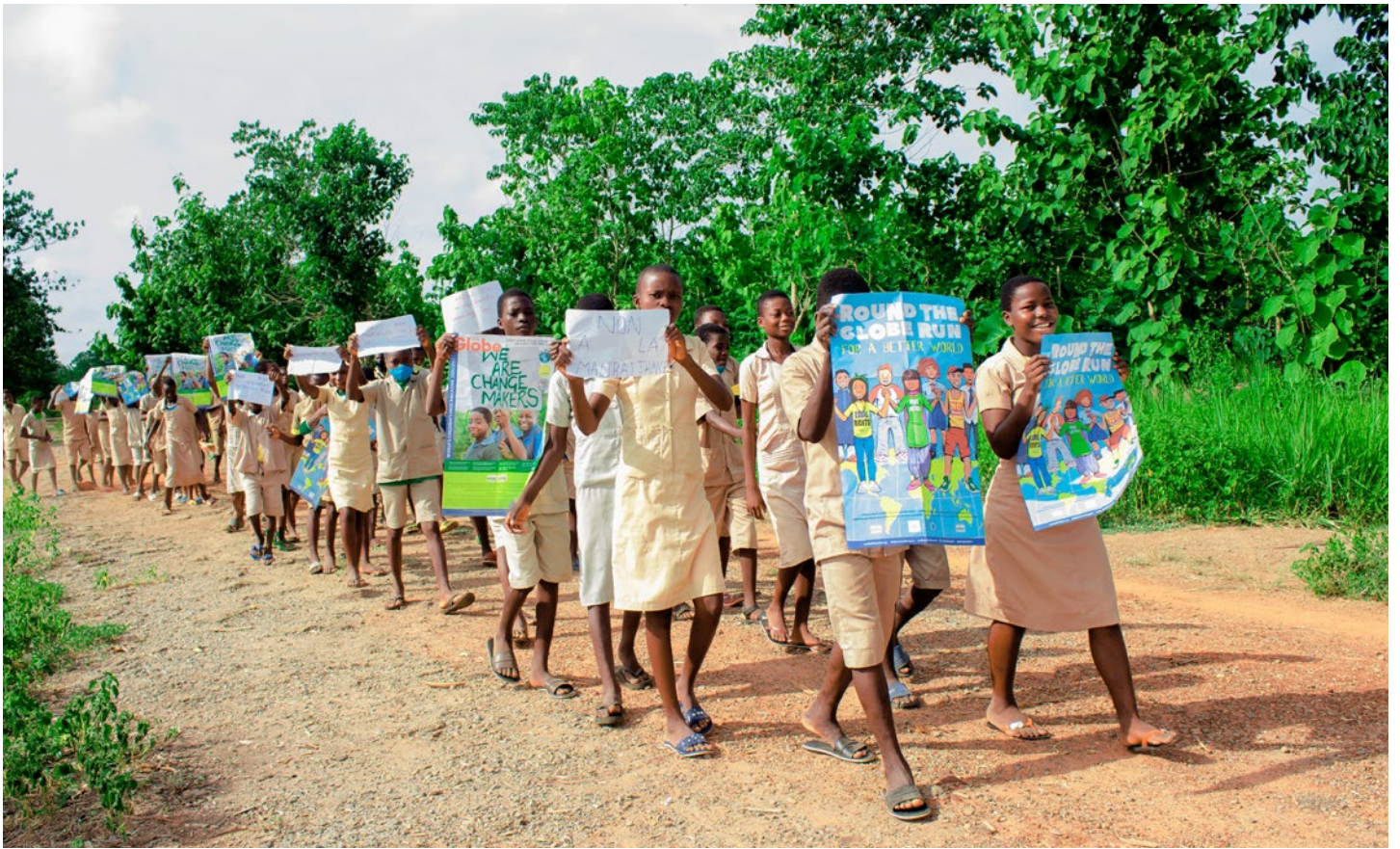
↑ I Massi-Zogbodomè i Benin vandrade barnen sina tre kilometer medan de höll upp affischen för Jordan Runt-loppet och sina krav på förändringar i lokalsamhället.