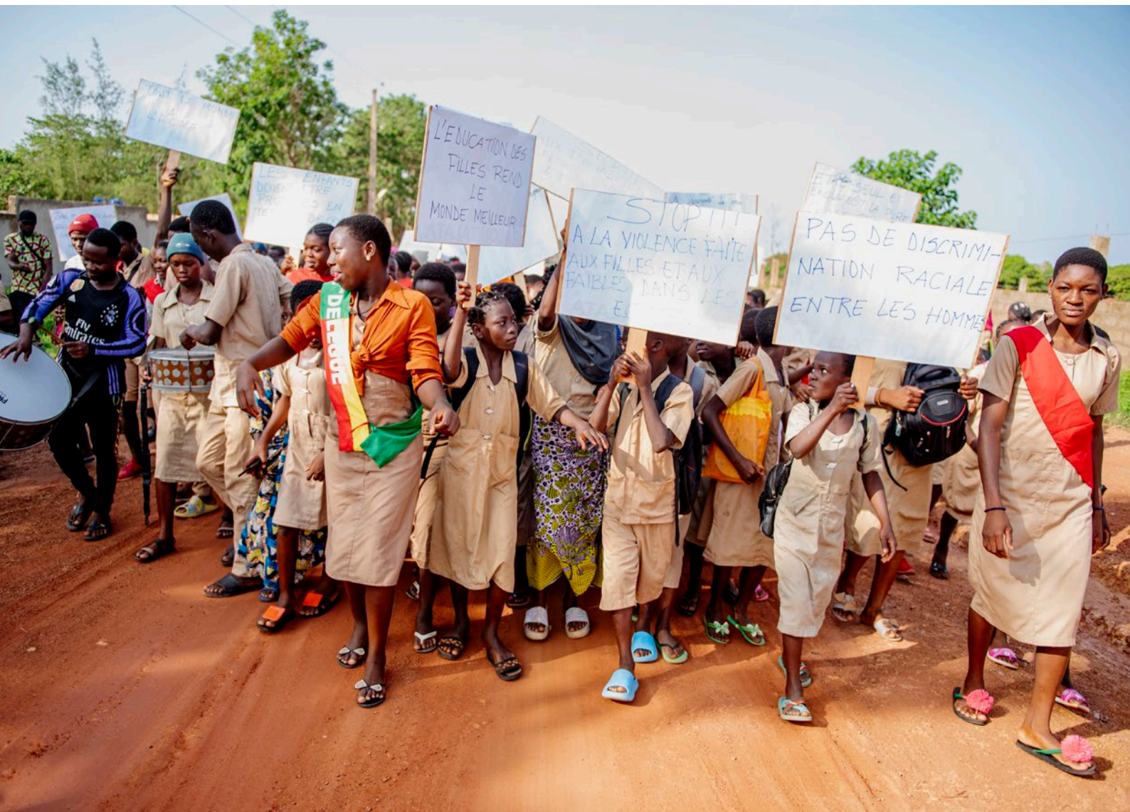
↓ I Parakou i Benin dansade barnen tre kilometer under sitt Jordan Runt-lopp för en bättre värld medan de bar sina plakater om förändringarna som de vill se.