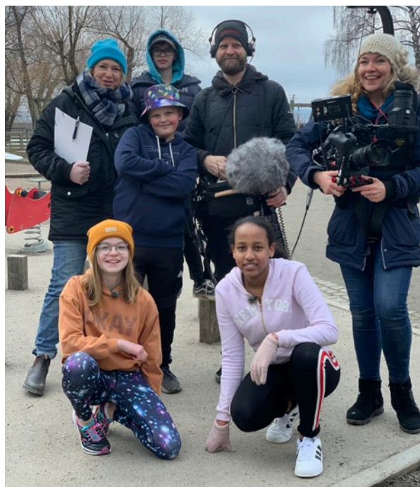
UR gjorde ett program om Gateskolans Jordan Runt-lopp i Arvika.

engagemang för att sig hundra varv runt jordklotet för en bättre värld, intresserade många. I Sverige gjorde såväl lokaltidningar som Lilla Aktuellt stora inslag där barn och olympier intervjuades. Även i andra länder kom både lokala och nationella medier till barnens egen manifestation och Jordan Runt-lopp. I t.ex. Zimbabwe intervjuades WCP-