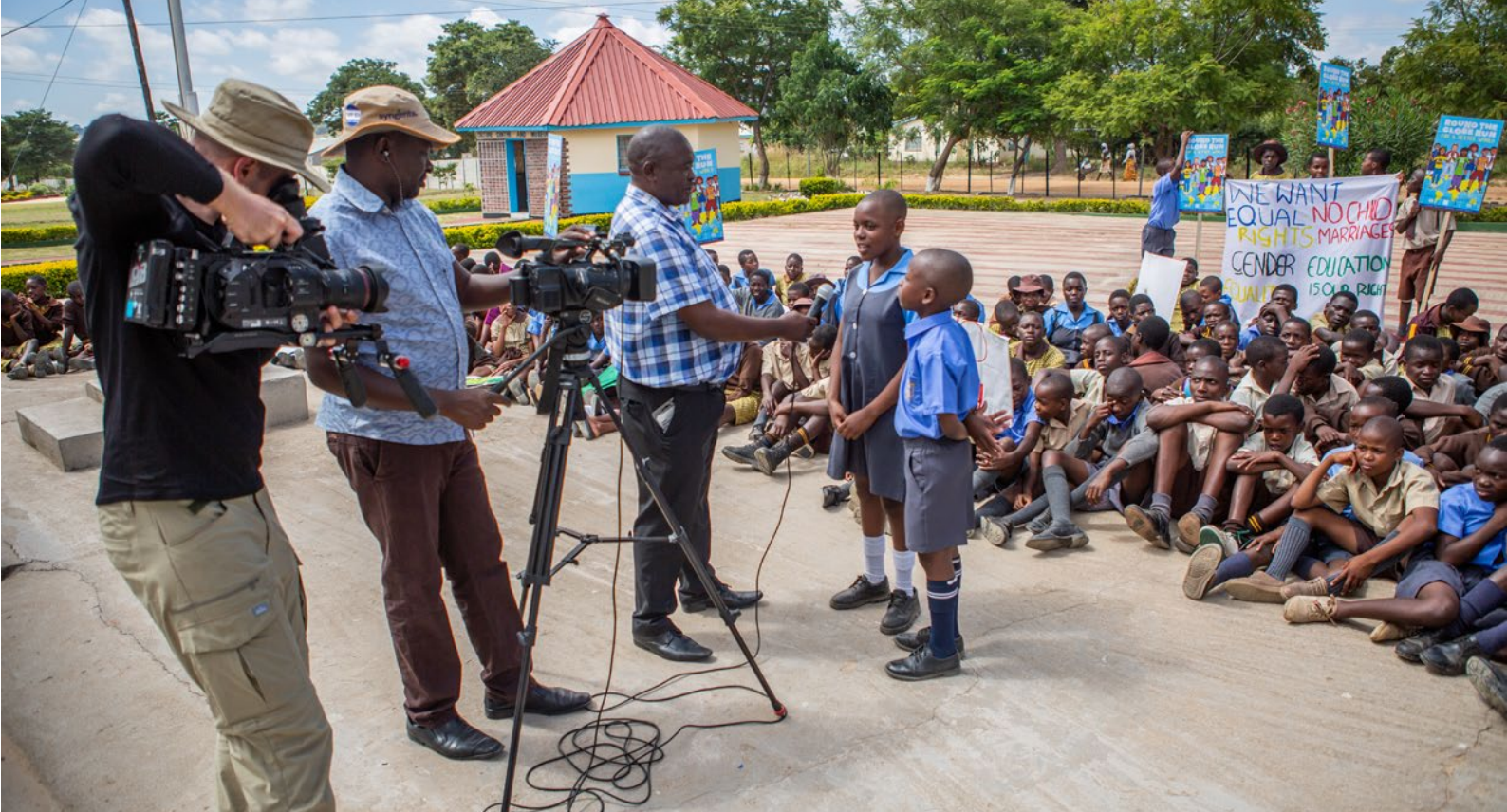
Inslaget från Hurungweskolans Jordan Runt-lopp i Zimbabwe visades i åtta nyhetssändningar i det nationella TV-bolaget ZBC.