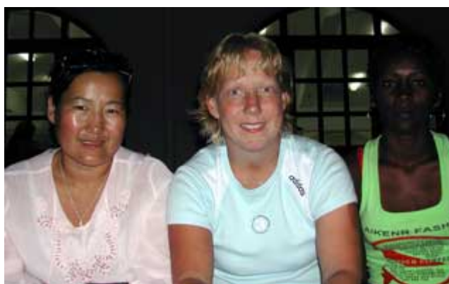
Tillsammans på marmortrappan

Första middagen i matsalen blev en stor kontrast mot det vi upplevt i Aten. Det var närmare skolbespisning än restaurang och ljudvolymen var enorm när vi var upp emot 200 personer som åt samtidigt i betonglokalen. Men tjusningen var att man kunde slå sig ner var som helst och prata med vem som helst från ett land som var bekant eller helt främmande för en själv. Maten var inte någon större kulinarisk upplevelse under de två veckorna på Akademien, och när man tog sig i kragen och gick ner till byn och åt så uppskattade man det desto mer. Efter middagen visade det sig att marmortrappan skulle bli samlingsplatsen nummer ett.