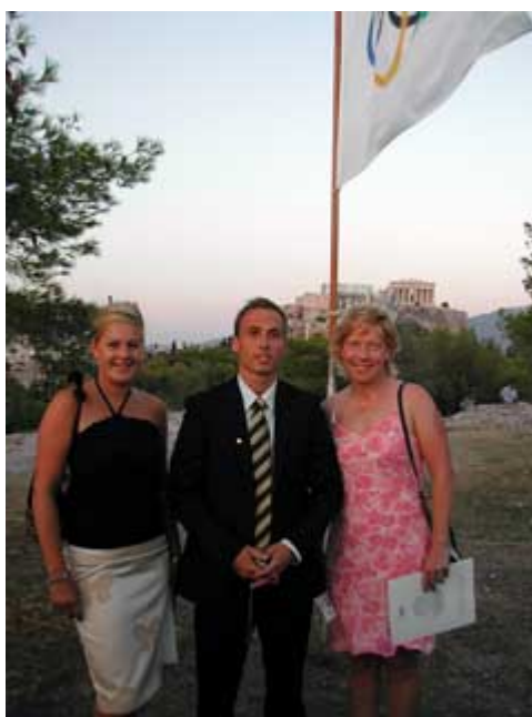
Invigningsceremonin på The Hill of Pnyx

På kvällen var det invigningsceremoni på The Hill of Pnyx. När Grekland under några få hundra år gick från diktatur till en elementär form av demokrati, så säger man att The Hill of Pnyx är platsen där demokratin uppstod. Eller den faktiska platsen där atenarna hade sina demokratiska möten. På denna historiska mark hade vi vår invigningsceremoni. Alla var uppklädda och när orkestern spelade The Olympic Anthem fick man gåshud av den magiska stämningen.