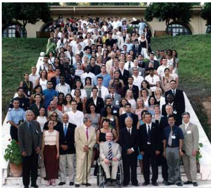
Presidenten av IOA, föreläsare, koordinators och deltagare samlade på marmortrappan

Internationella Olympiska Akademin arrangerade för 45:e gången en session för unga deltagare upp till 35 år från hela världen. Medlemsländerna i Internationella Olympiska Kommittén (IOK) får möjligheten att sända upp till tre representanter till Olympia under en tvåveckors period. Vi var ca 170 deltagare plus koordinators och föreläsare på plats från drygt 90 länder. Spännande var att könsfördelning var så gott som 50-50 mellan kvinnor och män. Tanken med sessionen är att utbilda deltagarna i Olympism och den Olympiska rörelsen för att sedan i respektive hemländer kunna föra budskapet vidare.