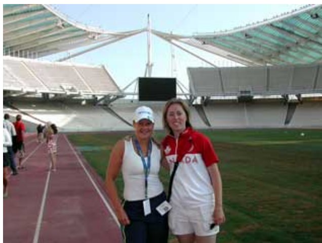
Inne på Olympiastadion

Nästa stopp, flera timmar senare var Delfi. Där klättrade vi uppför berget till den arkeologiska utgrävningsplatsen och fick höra vår guide berätta om de grekiska gudarna och oraklet i Delfi. Varmt var det och när vi gick in i det luftkonditionerade museet kändes det som en befrielse. Efter en utsökt lunch på finaste restaurangen i Delfi, så fortsatte vår resa mot Olympia och The Academy.