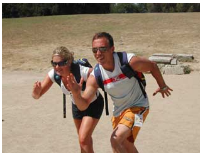
På startlinjen, Ancient Olympia

Efter frukost väntade ett besök på Museet och den arkeologiska utgrävningen av det antika Olympia, det vill säga den antika olympiska stadion. En speciell känsla att gå i gången fram mot stadion, ta plats på startlinjen och springa några meter, eller klättra upp på kullen och se stadion lite från ovan. Klassisk mark, verkligen!